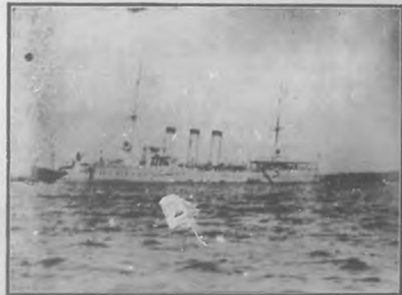
Crucero alemán "Breemen" surto en bahía.