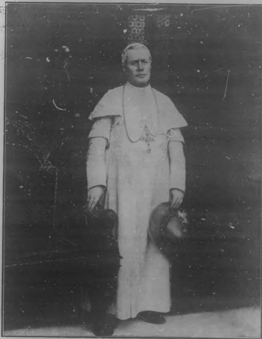
S. S. PIO X

A la hora de entrar en maquina este número de "Bohemia" recibíase las más contradictorias noticias referentes al estado de S. S. Pio X cuyo retrato honra nuestra página de honor.