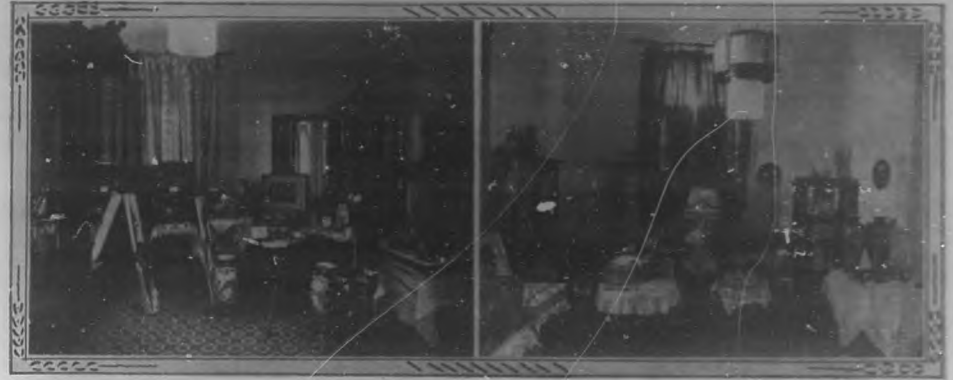
Exposición de los regalos con que fueron obsequiados los esposos Lorenzo de Castro-Teté Berenguer, con motivo de su reciente boda. La mayor parte de ellos proceden de la acreditada casa Barbois.

Que la diosa Felicidad les sonría siempre son nuestros deseos.