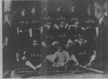
CAIBARIEN.—Club "Yara" cuyos triunfos han tenido gran resonancia en la jurisdicción de Remedios.